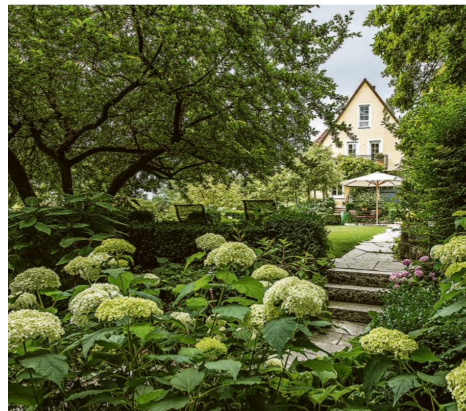
Eine Frage der Zeit: Der diesjährige Siegergarten ist über viele Jahre weiterentwickelt worden.

An den Gegebenheiten lässt sich nur selten etwas ändern. Häuser, die so dicht stehen, dass sie aufdringlich wirken, ein steiles Gefälle, unansehnliche Ausblicke. Dann wiederum gibt es See- oder Bergpanorama oder stilvolle Villen in der Nachbarschaft. All das wirkt sich auf einen Garten aus. Doch selbst wenn die Gegebenheiten optimal sind, heißt es nicht, dass auch der Garten stimmig ist. Mal wird in überkommenen Strukturen verharrt, mal sind Planer am Werk, die zwar die moderne Formensprache beherrschen, denen es jedoch nicht gelingt, dem Garten eine Seele zu geben. Es fehlt nicht an perfektem Design, an edlen Materialien und ausgewählten Gehölze, und doch will sich kein Glücksgefühl einstellen.