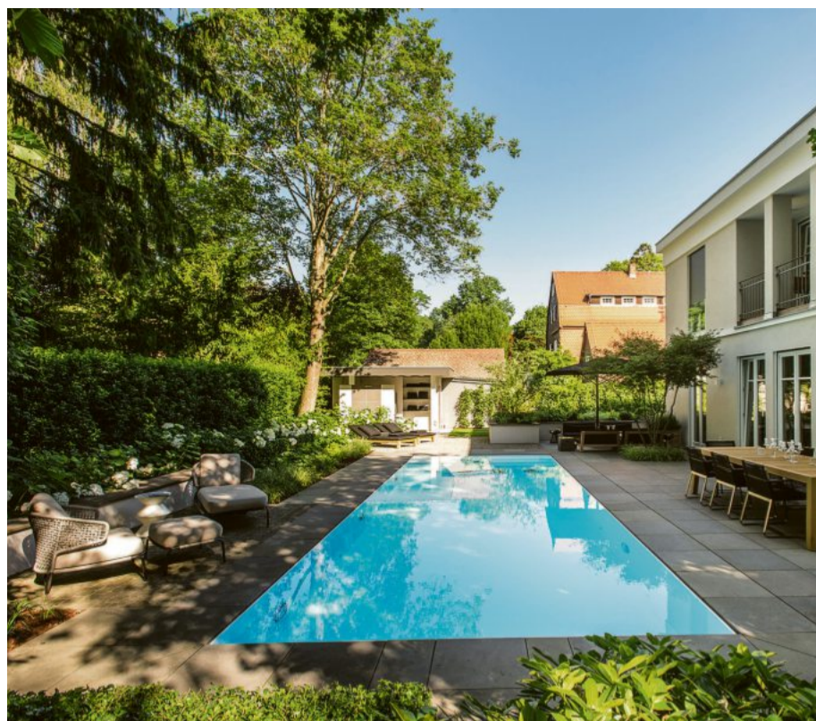
„Plätzchen für alle“: Mehr als Grün im hessischen Dreieich