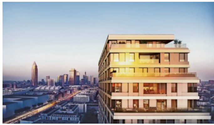
Steht mitten im urbanen Leben mit freier Sicht auf die Frankfurter Skyline: das Solid Home.

Das Hochhaus als Inbegriff modernen Wohnens – diese Idee, die zum Ende des 19. Jahrhunderts aufkam, wird mit dem Wohnturm Solid Home in Frankfurt in die Gegenwart geführt. So zeitgemäß das Konzept ist, so zeitlos erweist sich die architektonische Umsetzung.