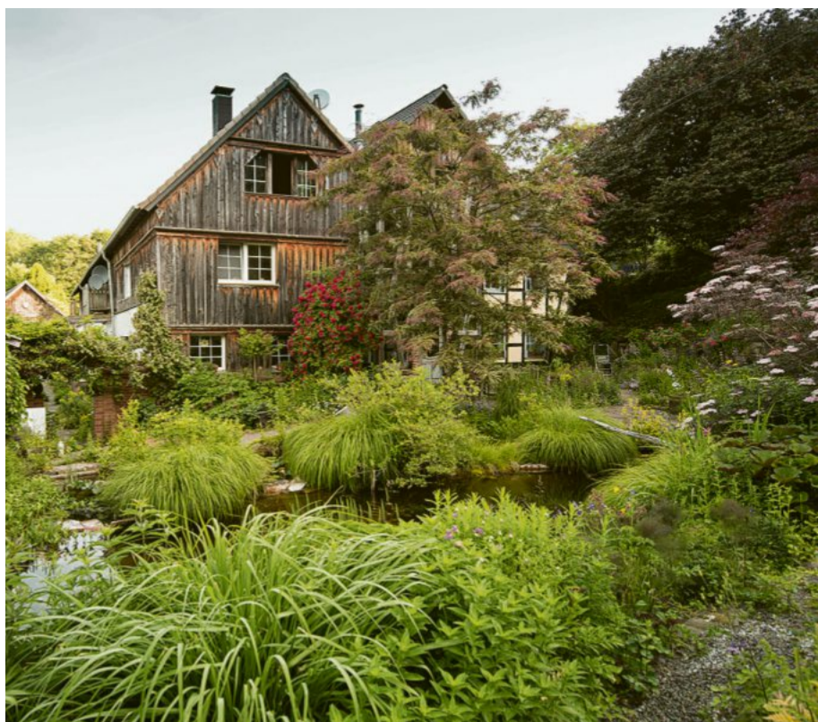
Biotop de luxe: Ommertalhof im Bergischen Land